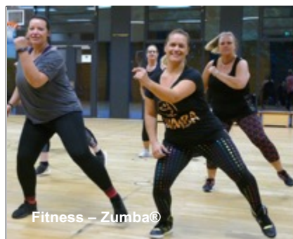
Fitness – Zumba®

Ihr Vorteil: für einen Beitrag nutzen Sie beliebig viele Gruppen einer Abteilung!