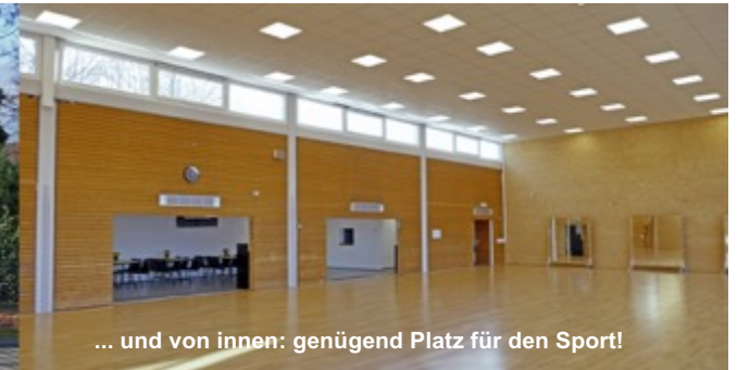
... und von innen: genügend Platz für den Sport!