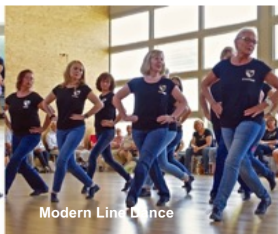
Modern Line Dance